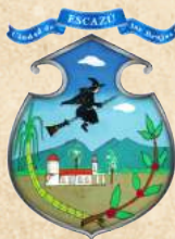
Municipalidad de Escazú

Prohibida la reproducción total o parcial de esta obra, sin el consentimiento expreso y escrito de la Municipalidad de Escazú.