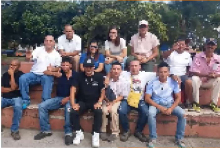
Actividad realizada durante el día, en el Parque Central de Escazú.