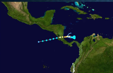
Huracán Otto Categoría 3