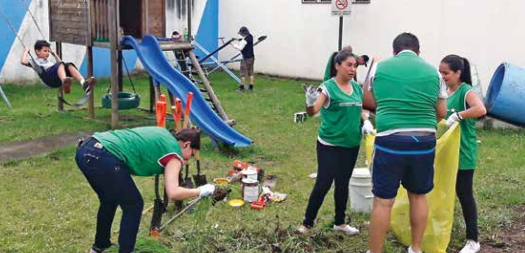
Actividades en el espacio público del cantón, ejecutadas por parte de la RRSEE y el voluntariado profesional de sus empresas.

Las actividades se encuentran calendarizadas para todo el año. La dinámica para la ejecución de los planes de trabajo es que cada comité coordina sus reuniones, la mayoría de las veces se celebran de manera bisemanal, y cada empresa asume la sede para las mismas.