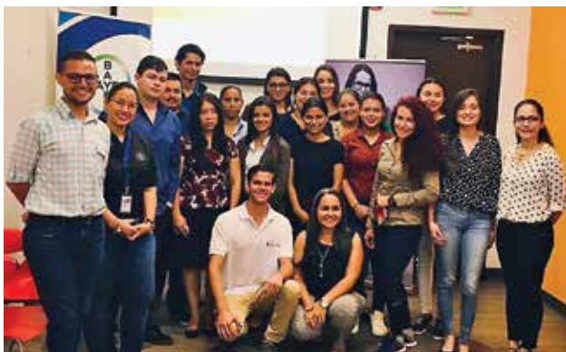
Visitas guiadas dirigidas a estudiantes del Centro de Formación Municipal, a empresas del cantón.

Esta organización tiene un Convenio de Cooperación firmado con la Municipalidad de Escazú con el objetivo de implementar un proyecto de Empleabilidad y Emprendedurismo Juvenil en el cantón. Además, tiene la responsabilidad de capacitar a los voluntarios (colaboradores de las empresas socias de la Red) que se encargarán de dar el programa de educación a los jóvenes que se inscriban. (Fundación Aliarse, 2018, p. 5).