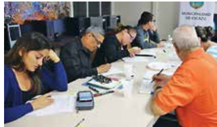
Integrantes de Juntas participando de un módulo temático como parte del Programa de Formación de Juntas.

El boletín de la RRSEE se puede encontrar en el siguiente enlace: http://escazu.go.cr/es/la-municipalidad/red-de-responsabilidad-social