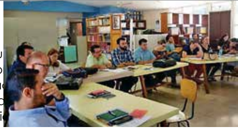
Integrantes de Juntas participando de un módulo temático como parte del Programa de Formación de Juntas.

Durante el 2018, se desarrollaron módulos formativos, distribuidos en un total de 12 sesiones. Los talleres fueron facilitados entre la Municipalidad de Escazú, la Fundación Gente y las empresas: Unicomer, BAC y Portafolio Inmobiliario.