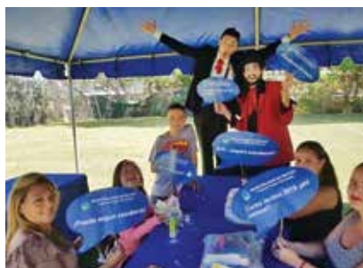
Madres, niños y niñas beneficiados durante la actividad de entrega de los paquetes de la Campaña de Donación de Útiles Escolares, 2019.

Esta institución se encarga de guardarlos y distribuirlos según grado y año lectivo correspondiente. En cada ocasión se ha llevado a cabo una actividad para la entrega oficial de los paquetes a los niños, niñas y familias beneficiadas.