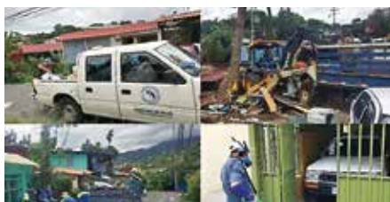
Acciones de recolección de basura y fumigación de casas de varias comunidades del cantón, durante la campaña contra enfermedades vectoriales. Fuente: Municipalidad de Escazú.

En los meses de julio a agosto de 2017, se hizo una campaña contra enfermedades vectoriales en las comunidades de: Bajo de los Anonos, Barrio el Carmen, Barrio San Francisco de Asís, Barrio Corazón de Jesús y Barrio el Diezmo; además de los caseríos adyacentes a estos barrios. Para llevar a cabo esta campaña, la empresa Bayer aportó suficiente insecticida para la fumigación de puntos seleccionados en las comunidades del cantón. Además de la fumigación, al finalizar la campaña se logró recolectar un total de 419 130 kg (419.1 Ton) de basura no tradicional en estas comunidades.