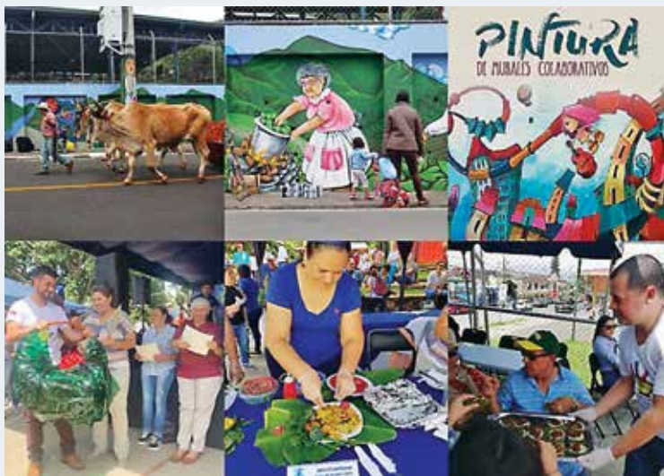
Actividades ejecutadas por parte del Comité de arte, cultura y recreación de la RRSEE.

Actualmente los planes de trabajo se encuentran muy completos y alineados a los objetivos que persigue la Red.