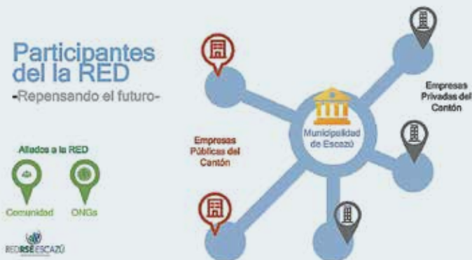
Fuente: Estrategia de la RRSEE 2018-2023.

Los participantes son las figuras que se encuentran conformando y haciendo posible la labor de la RRSEE y representan las esferas privadas, públicas y de la sociedad civil.