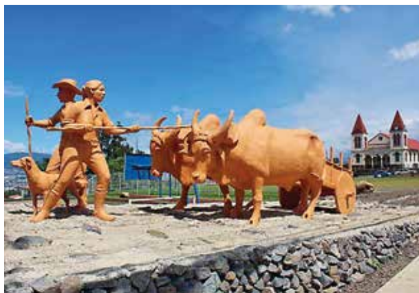
Monumento al Boyero y la Boyera de Escazú.

El objetivo de la misma, era reconocer los diferentes enfoques que tenían las empresas en materia de RSE, y que estas conocieran las prioridades que tenía el gobierno local en temas de desarrollo social y ambiental. Lo anterior, para identificar en conjunto, posibles líneas de acción y mecanismos de coordinación de acciones y proyectos.