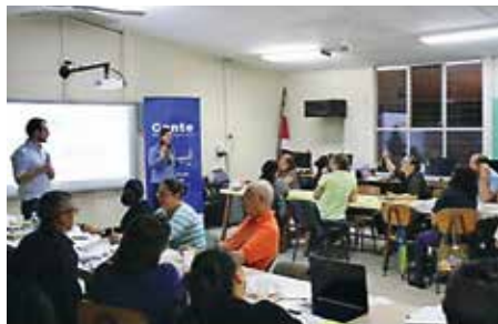
Integrantes de Juntas participando de un módulo temático como parte del Programa de Formación de Juntas.