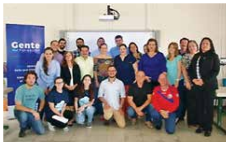
Integrantes de Juntas participando de un módulo temático como parte del Programa de Formación de Juntas.

La Fundación Gente fue invitada a la RRSEE a exponer su modelo de apoyo a Juntas. Empresas de la Red, mostraron su interés en apoyar esta labor en el contexto del cantón de Escazú. Manifestaron sus posibilidades de facilitar talleres de capacitación, según sus áreas de acción y giro de negocio, en el marco de este Programa. Se trabajó en un diagnóstico de necesidades de fortalecimiento y apoyo a las Juntas, se definió una metodología de trabajo y de esta manera fue que se diseñó el Programa de Formación.