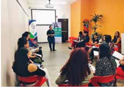
Estudiantes durante capacitaciones de cursos facilitados por voluntariado profesional de las empresas de la RRSEE.

Este Programa se caracteriza por fomentar opciones de empleo y educación dirigido, mayoritariamente, a la población juvenil y de mujeres del cantón.