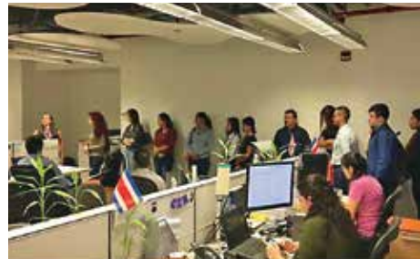
Visita guiada de estudiantes a empresas del cantón.

Empresas pertenecientes a la RRSEE como el Costa Rica Country Club, Improsa, Portafolio Inmobiliario, Bayer, entre otras; han tenido la oportunidad de recibir jóvenes pasantes en sus ámbitos laborales por periodos de hasta tres meses. Las empresas les facilitan viáticos y se han dado casos en que, terminadas las pasantías de estos jóvenes, son contratados por la empresa en la que ejercieron la práctica.