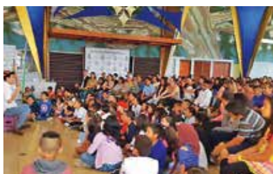
Actividad de entrega de paquetes, como parte de la Campaña de Donación de Útiles Escolares, 2019.