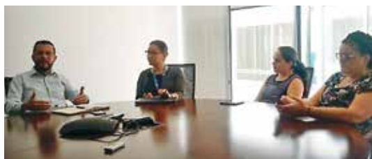
Grupo focal con el equipo técnico de la RRSEE.

Posteriormente, se convocó a las empresas a una reunión para definir un grupo de profesionales de la misma Red, quienes serían las personas encargados de acompañar a la consultora durante el proceso de elaboración y revisión del plan estratégico.