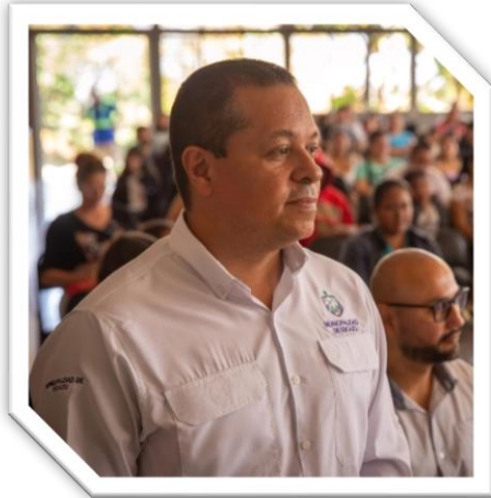
Orlando Umaña Umaña Alcalde de Escazú

"Las alianzas son vitales para el desarrollo de los territorios, es por esto que las instituciones públicas debemos trabajar de la mano con las empresas privadas para brindar las mejores condiciones de vida a todas las personas habitantes. La Red de Responsabilidad Social Empresarial de Escazú, es un claro ejemplo de una alianza sólida entre lo público y privado para alcanzar el desarrollo social, cultural, ambiental y económico de las personas que habitan este cantón. La articulación de los esfuerzos en el marco de esta Red impulsa la transformación hacia la construcción de una comunidad sostenible.